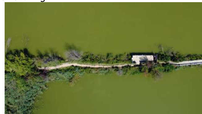
Foto aeree di briglie e pontili