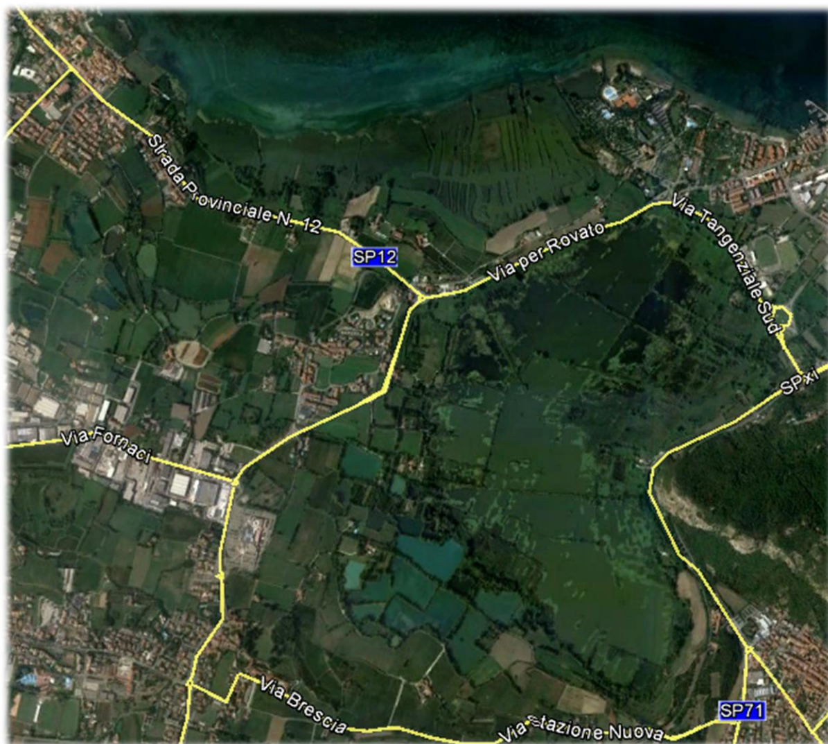
Figura 1, foto aerea delle aree di pertinenza della Riserva Naturale Torbiere del Sebino

La Riserva Naturale delle Torbiere del Sebino, sito SIC/ZPS IT 2070020 di circa 360 ettari di estensione, è una zona umida composta prevalentemente da canneti e specchi d'acqua, situata sulla sponda meridionale del Lago d'Iseo e posta sul territorio dei Comuni di Iseo, Provaglio d'Iseo e Corte Franca. Una parte, quella più esterna denominata Lamette, è direttamente interconnessa con il Lago d'Iseo, mentre la parte più interna, formata da grandi vasche intervallate da sottili argini di terra e denominata Lama, è connessa con la parte più esterna da un canale regolato.