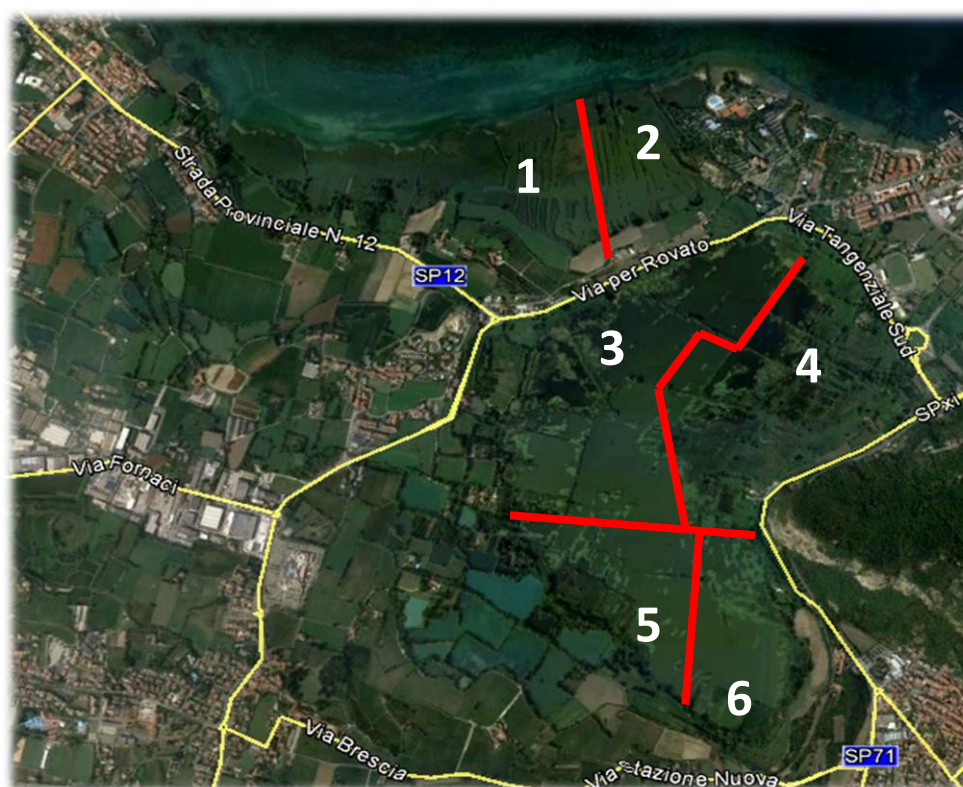
Figura 2, suddivisione aree di indagine

Il monitoraggio è stato condotto per un unico periodo, a cavallo tra i mesi di ottobre e novembre 2019, con l'uso della sola elettropesca da natante.