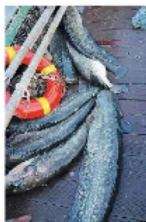
Presi. Alcuni peso siluro

A caldeggiare la riapertura «urgente» delle battute di pesca selettiva alla vorace specie ittica sono stati la Riserva delle Torbiere - capofila dell'esperimento - ed i pescatori professionisti sebini, sostenuti nel loro intento dalla Regione Lombardia, dall'Ufficio pesca della Provincia di Brescia e dalla Polizia provinciale.